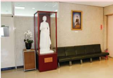
ナイチンゲール像