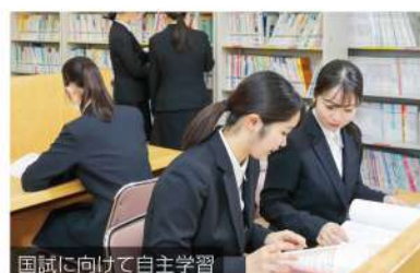
国試に向けて自主学習