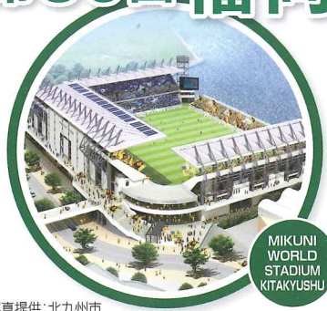
MIKUNI WORLD STADIUM KITAKYUSHU